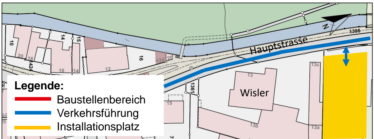
Skizze 2: Ersatzparkplätze auf dem IP-Wisler

Wir bitten Sie, allfällige Pächter oder Mieter Ihres Grundstücks direkt über die anstehenden Beeinträchtigungen zu orientieren.